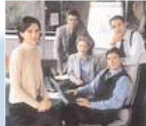
Ein kleiner Teil aus einem engagierten Team

Dieses Netzwerk von ausgewiesenen Experten erarbeitet für die Praxis maßgeschneiderte Informationsprodukte.