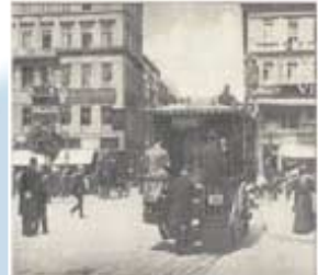
Berlin, Unter den Linden

Eine sinnvolle Verstärkung. Zum Markt-Know-how von Behr's kommen die WEKA-Erfahrungen im Fachbuch-Marketing und dem Einsatz elektronischer Medien.