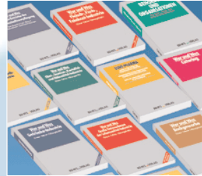
Informationsvorsprung mit „WER und WAS“

9 Branchenporträts der Ernährungsindustrie mit CD-ROMs werden ergänzt von 3 technischen Einkaufsführern und einem Adressbuch der Behörden und Institutionen der Agrar- und Ernährungswirtschaft.