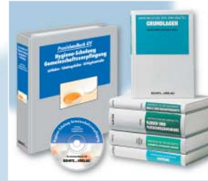
Ein breit gefächertes Verlagsprogramm

Für die innerbetriebliche Schulung liefert Behr's Folien, Videos und CD-ROMs mit interaktiven Trainingsprogrammen.